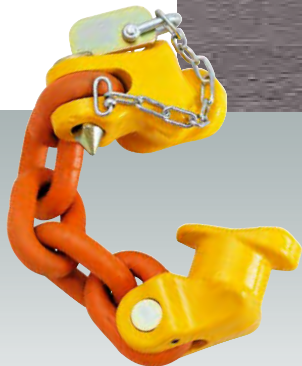
HAMMAR Twinlock – um exemplo de nossa tecnologia já patenteada.

Se a palavra HAMMAR está escrita nos seus carregadores laterais, você está seguro. Ano após ano.