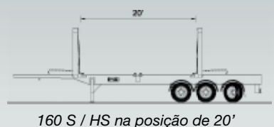
160 S / HS na posição de 20'

HAMMAR 160 E. A grua traseira possui um alongamento chamado 'slide' (deslizante) e na posição de 45° ela é projetada para fora atrás do chassi. A proteção inferior é acoplada mecanicamente ao guindaste e assim fica bem na traseira do trailer. Quando as gruas são movidas novamente para a posição de 20° ou 40°, a proteção inferior acompanha a grua e trava na posição correta.